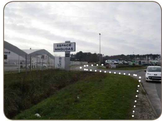
Panneau «Espace Magudas»

Trajet piéton depuis les arrêts de bus La Morandière : moins de 5 minutes